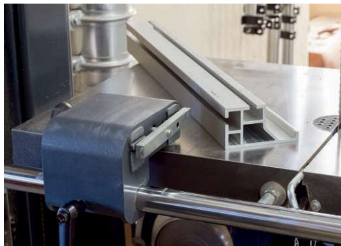
Dettaglio del sistema di fissaggio della riga al supporto di ghisa.

Abbiamo con l'ausilio di una staggia controllato la posizione dei volani, risultati correttamente allineati fra loro.