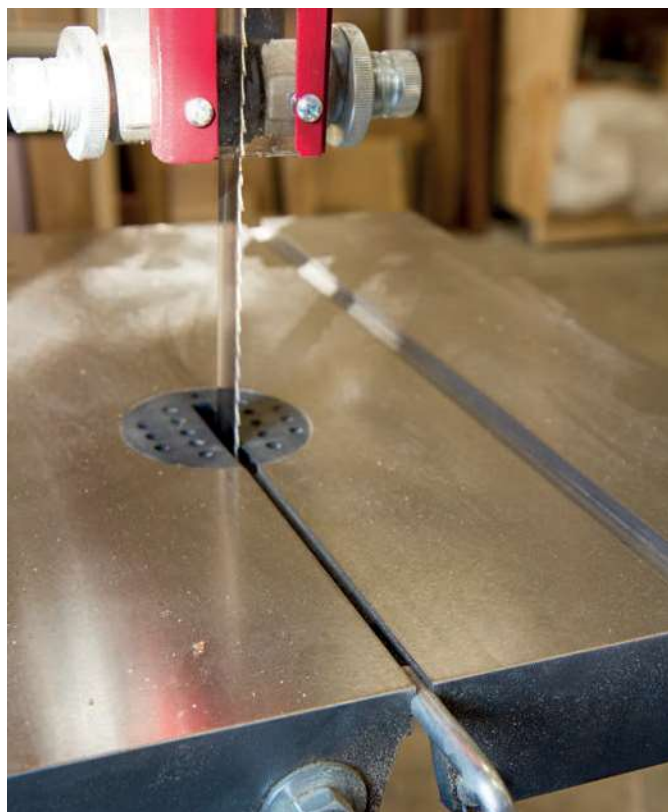
Il tappo del piano in corrispondenza del passaggio della lama è realizzato in plastica ed è forato per consentire il passaggio della segatura.