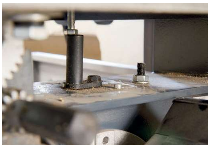
Dettaglio delle guide semicircolari per inclinare il piano. Per la regolazione negativa del piano ( 0-10^{\circ} ) è necessario ruotare la battuta del bullone di arresto.