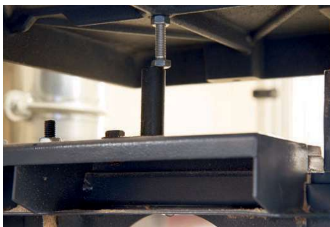
Il bullone regolabile posizionato al di sotto del piano serve a riposizionare con rapidità il piano sullo 0^{\circ} . Va regolato in proprio e bloccato con l'apposito dado.

Per consentire l'utilizzo di accessori utili alle lavorazioni più varie il piano è dotato di una scanalatura, indice di attenzione della casa di produzione, verso un utilizzo più ampio possibile della sega. Negli optional in commercio sono infatti disponibili alcuni accessori come la guida orientabile e il dispositivo per i tagli circolari. Il piano è orientabile da -10^{\circ} a +45^{\circ} e il sistema di inclinazione è composto da due solide guide semicircolari di metallo fissate con dei bulloni al piano. L'inclinazione si comanda con un comodo ingranaggio a cremagliera collegato ad una manovella e, tramite una seconda manopola, si blocca il piano nella posizione desiderata. Il goniometro adesivo indica con una buona precisione l'inclinazione del piano. La sua lettura presenta un certo problema di parallasse, dovuto alla distanza seppur minima, dell'indicatore dalla scala millimetrata. Un bullone regolabile consente di riposizionare rapidamente il piano sullo 0^{\circ} . Su richiesta è possibile implementare la superficie del piano con delle prolungh.