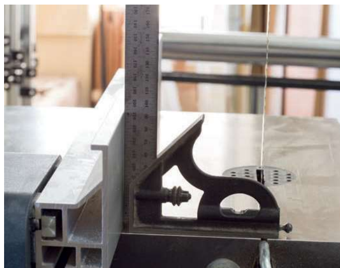
Sebbene sia impercettibile in fotografia, abbiamo riscontrato una leggerissima concavità nella superficie della riga in alluminio.